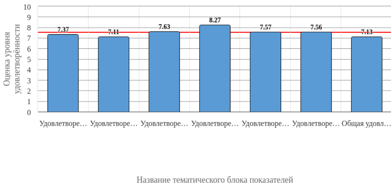
Рисунок 3.1 - Средняя оценка удовлетворенности (по всем тематическим блокам показателей)

Средняя оценка удовлетворенности респондентов по блоку вопросов «Удовлетворенность организацией обучения» равна 7.37, что является показателем повышенного уровня удовлетворенности (50-75%).